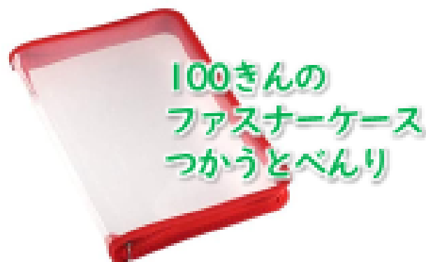
100きんの ファスナーケース つかうとべんり

◆ほかのコードなどとわからなくなってしまう わないように、しっかりかんりしましょう。 (きょうだいのとまちがわれないように)