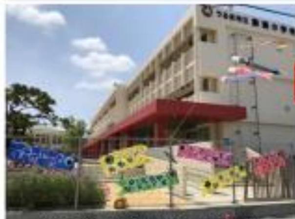
【最新情報はお知らせからご覧ください】