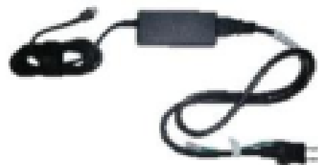
(ACアダプタ・電源プラグ)